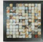
VIII Premio Nacional de Cerámica "Ciutat de Castelló" /2006