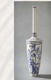
XIII Premio Nacional de Cerámica "Ciutat de Castelló" /2016