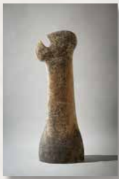
I Premio Nacional de Cerámica "Ciutat de Castelló" /1997