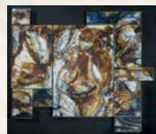
VII Premio Nacional de Cerámica "Ciutat de Castelló" /2004