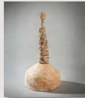
V Premio Nacional de Cerámica "Ciutat de Castelló" /2001