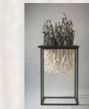
XV Premio Nacional de Cerámica "Ciutat de Castelló" /2020