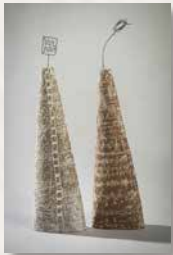
II Premio Nacional de Cerámica "Ciutat de Castelló" /1998