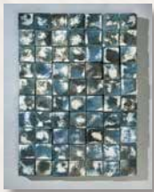
III Premio Nacional de Cerámica "Ciutat de Castelló" /1999